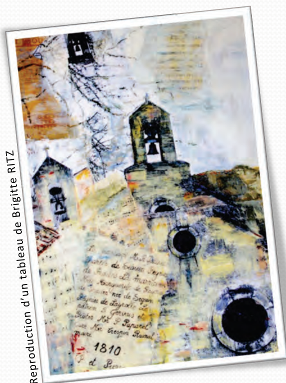
Reproduction d'un tableau de Brigitte RITZ

Carte Postale éditée à l'occasion des 200 ans de la cloche « Marguerite » de l'Eglise de Bruggers.