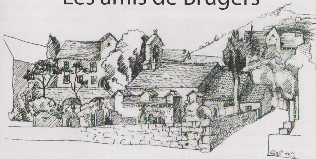
Le journal de l'association - n°3 - avril 2010